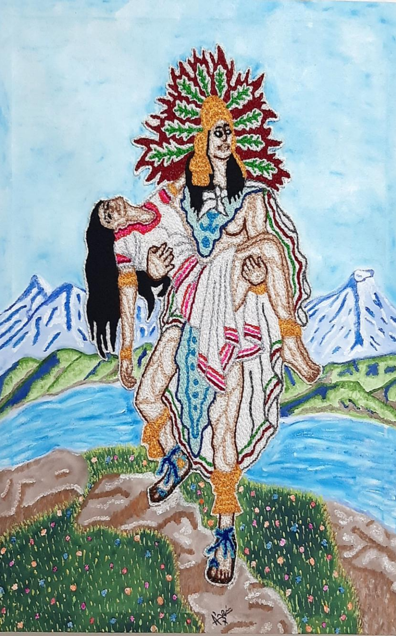
Cuadro: “ Nuestra Cultura Raíces ”

Técnica: Imágenes de hombre y mujer Azteca bordados a mano, fondo pintura óleo.