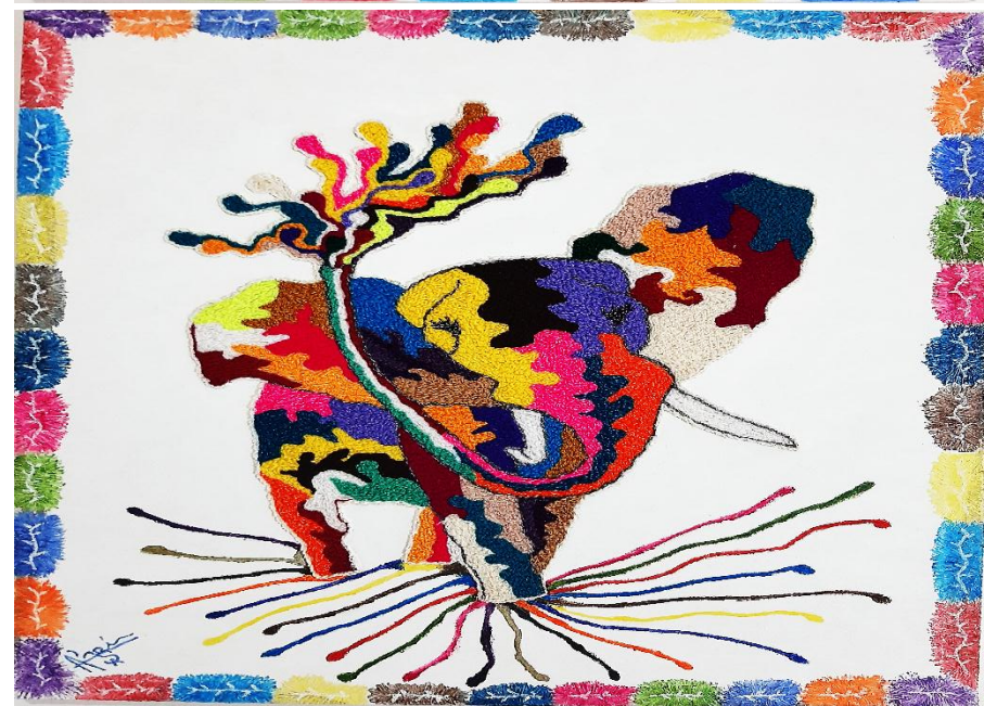
Cuadro: Buscando Refugio “ Libres ” Técnica: Imagen de jirafa, elefante bordados a mano, fondo pintura óleo.