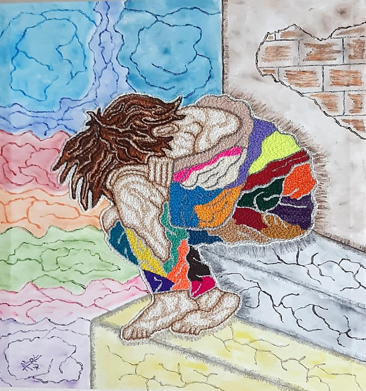
Cuadro: “ Marginado ”

Técnica: Imagen de niño bordado a mano, fondo pintura óleo.