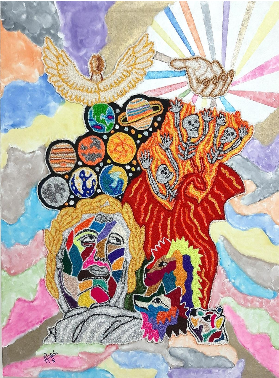
Cuadro: “ Encuentros ” de libro La Divina Comedia Técnica: Imágenes bordados a mano, fondo pintura óleo.