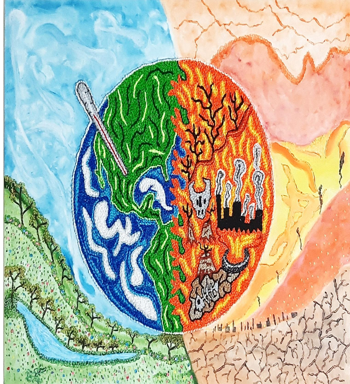
Cuadro: " Calentamiento Global "

"La creciente urbanización y el cambio climático crean juntos riesgos complejos, especialmente para aquellas ciudades que ya experimentan un crecimiento urbano mal planificado, altos niveles de pobreza y desempleo, y una falta de servicios básicos", "Pero las ciudades también ofrecen oportunidades para la acción climática: los edificios ecológicos, el suministro fiable de agua limpia y energía renovable, y los sistemas de transporte sostenible que conectan las zonas urbanas y rurales pueden conducir a una sociedad más inclusiva y justa."