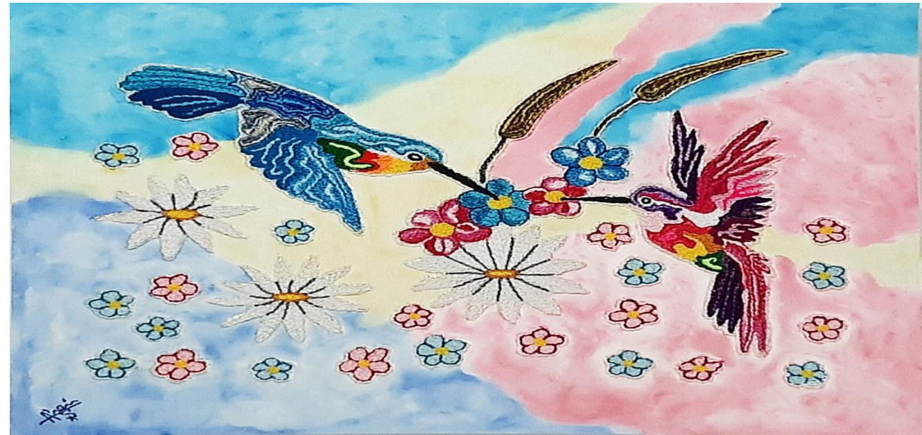
Cuadro: Buscando Refugio “ Libres ”

Técnica: Imagen de caballos, colibríes bordados a mano, fondo pintura óleo.