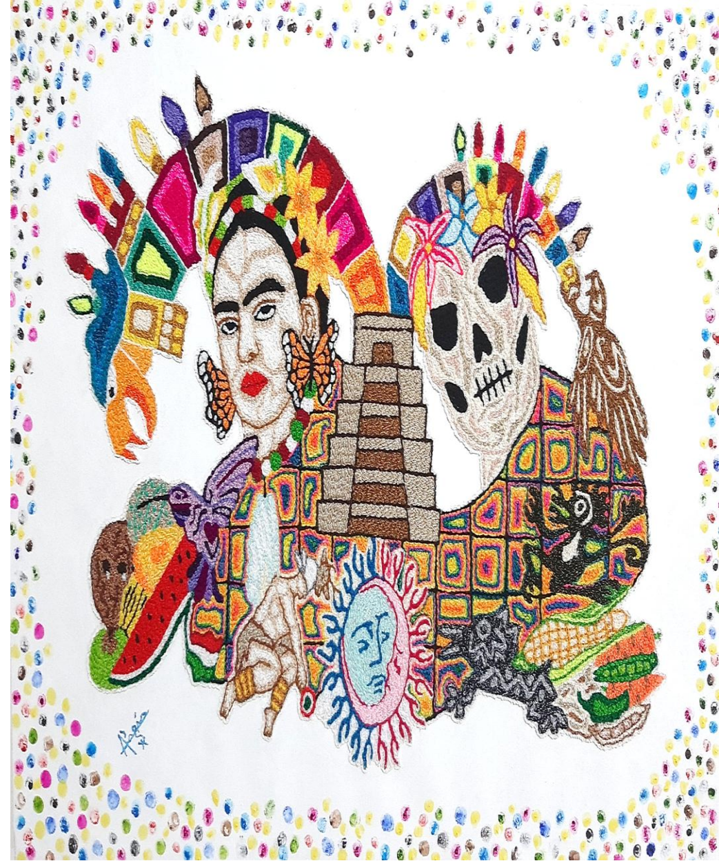
Cuadro: “ Nuestra Cultura Raíces ” Técnica: Imágenes bordados a mano, fondo pintura óleo.

Una de las costumbres que más destaca es colocar un altar, para dar la bienvenida a los difuntos que nos visitan estos días, muestras gastronómicas del país, y eventos como el Desfile de las Ánimas y el concurso de altares.