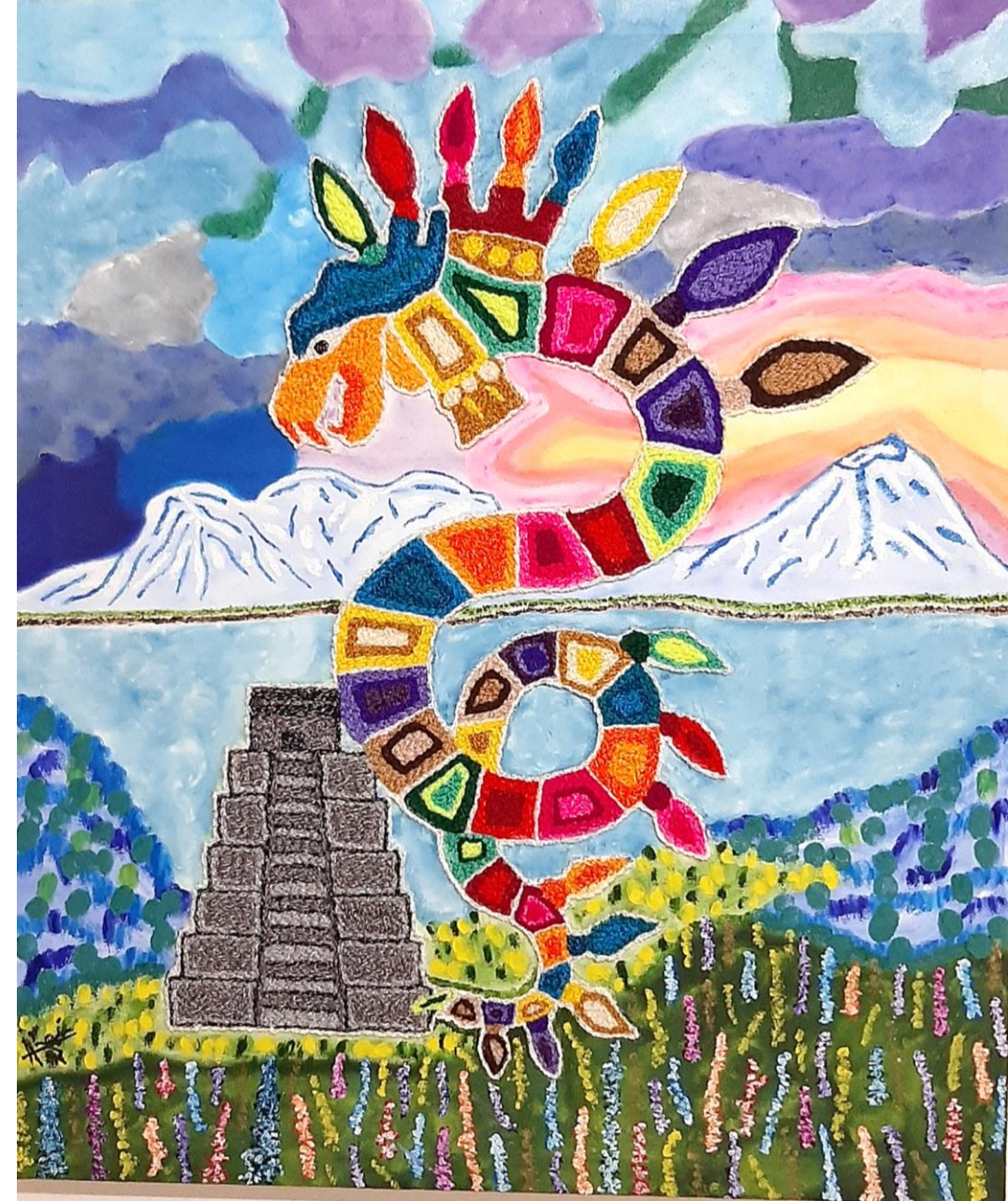
Cuadro: " Nuestra Cultura Raíces "

En cada localidad los músicos tienen por costumbre cantarle las mañanitas, ofrecer conciertos, y hacer gala de sus habilidades musicales. Es una excelente oportunidad para disfrutar de la mejor música mexicana.