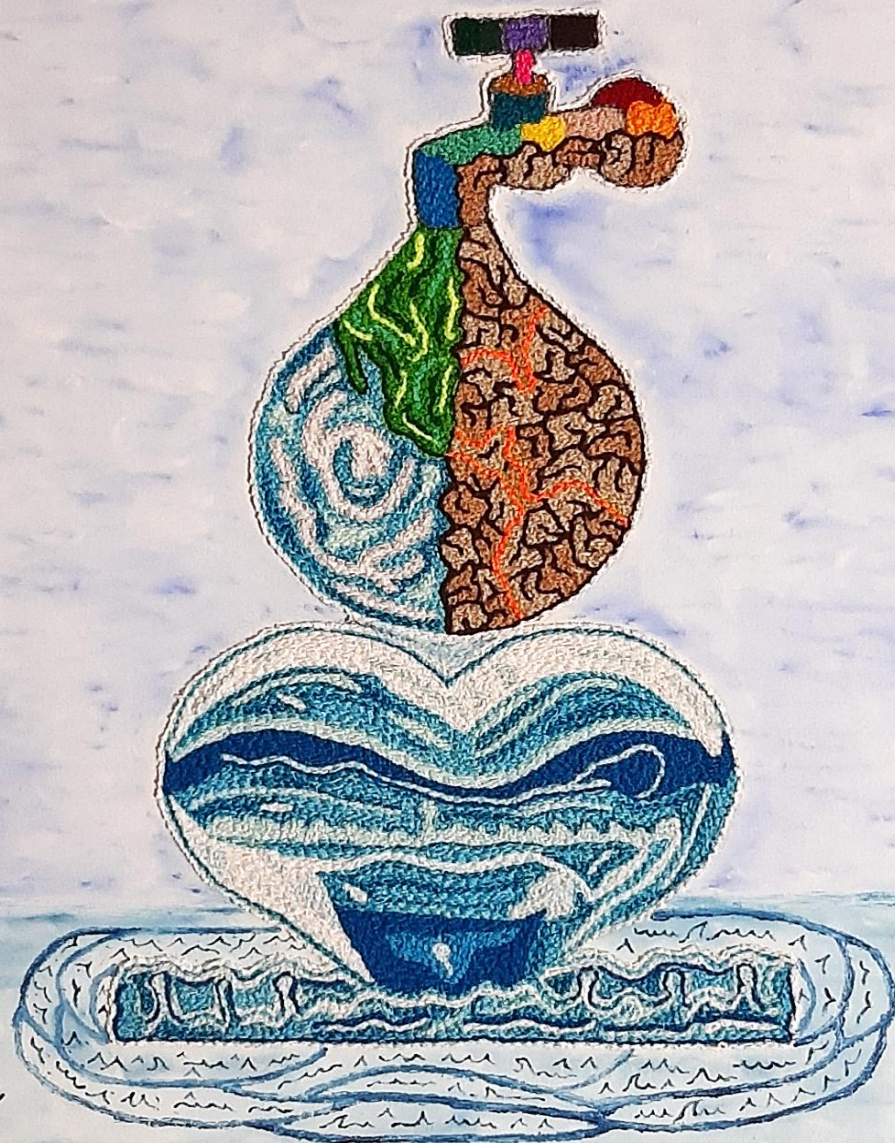
Cuadro: “ Agua es Vida ”

Técnica: Imágenes de llave, gota de agua viva y seca, gota de agua de corazón bordadas a mano, fondo pintura óleo.