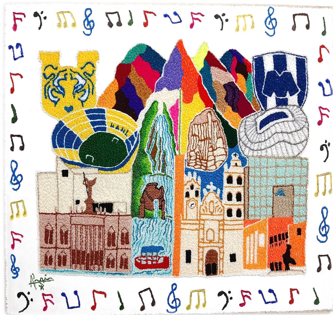
Cuadro: “ NL Extraordinario ”

en cada puntada y pincelada, se queda el reflejo del alma, en la tela se plasma, hasta convertirse en arte imaginada