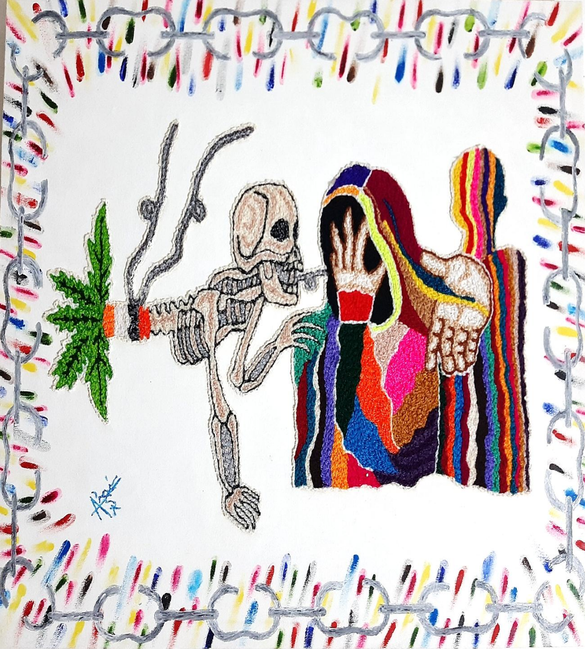
Cuadro: Trastornos “ Vencer Cadena ”

Técnica: Imagen de droga, cigarro, muerte, jóvenes bordados a mano, fondo pintura óleo.