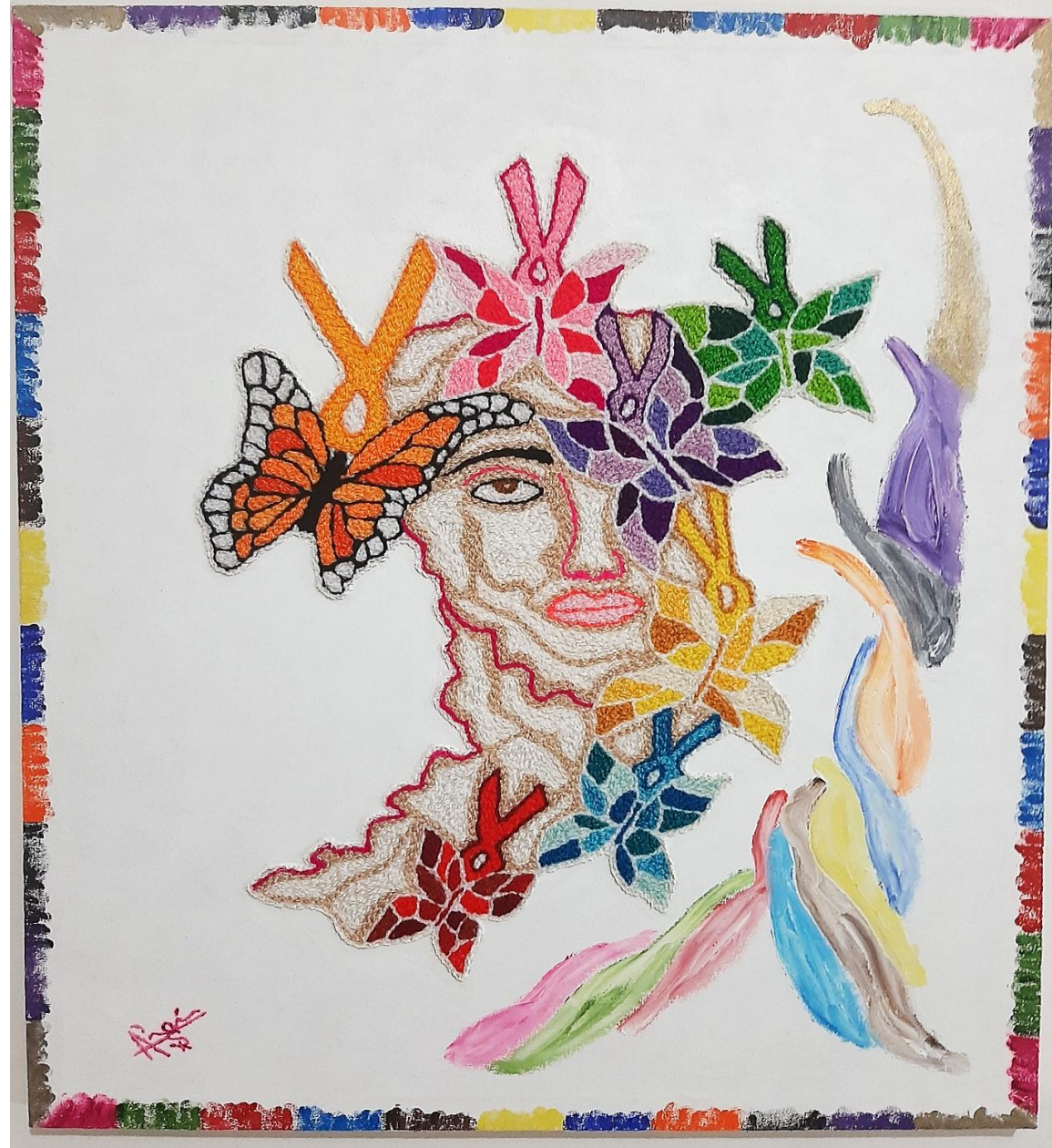
Cuadro: “ Vencer el Cáncer ”

Día Mundial contra el Cáncer el objetivo salvar millones de vidas cada año, sensibilizar, educar llamando a los gobiernos y personas del mundo que actúen contra la enfermedad. Desde 2019 hasta 2021, el tema Día Mundial contra el Cáncer es “Yo soy y voy a”, llamado colectivo a actuar reducir el impacto global del cáncer. Sea quien sea, este día invita a las personas a expresar quién son qué acciones tomarán para crear un mundo sin cáncer. Entre un tercio y la mitad de los casos de cáncer podrían prevenir disminuyendo factores de riesgo como consumo de tabaco, consumo nocivo de alcohol, la alimentación poco saludable y la inactividad física. La vacuna contra el virus del papiloma humano (VPH) también previene el cáncer cervicouterino. “El cáncer no tiene que ser nunca una sentencia de muerte, tampoco durante la pandemia de COVID-19”.