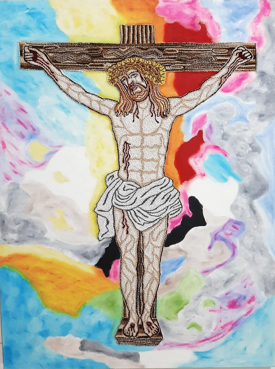
Cuadro: “ Crucifixión ”

Técnica: Imágenes de Jesús y Cruz bordados a mano, fondo pintura óleo.