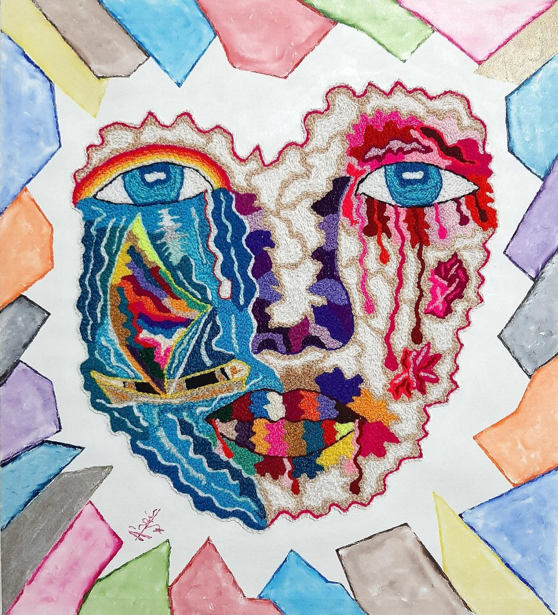
Cuadro: “ Tormenta de Emociones ” Técnica: Imagen de mujer violentada, el mar, el barco bordados a mano, fondo pintura óleo.