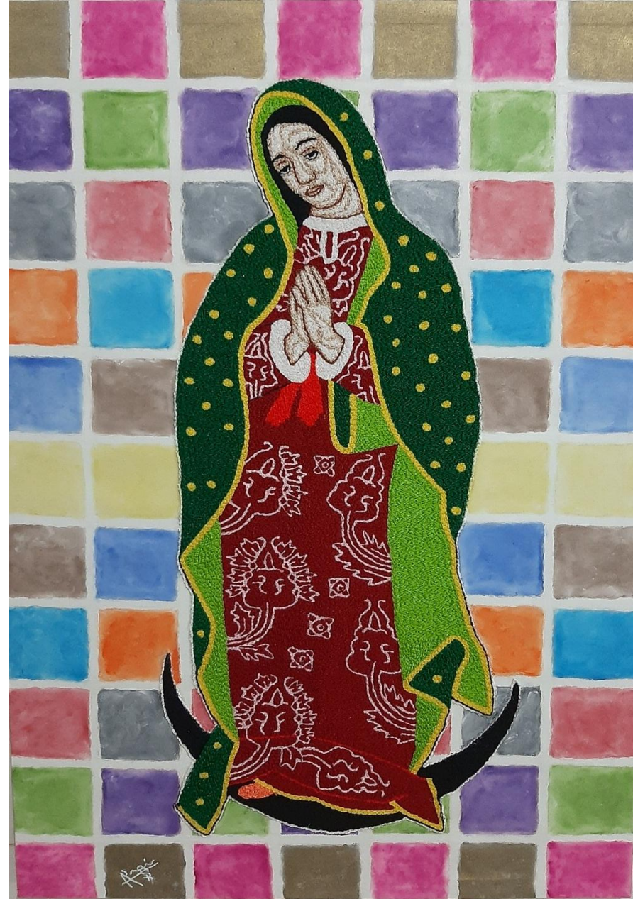
Cuadro: “ Virgen de Guadalupe ” Técnica: Imagen Virgen Guadalupe bordada a mano, fondo pintura óleo.

La rosca de reyes esconde en su interior varios muñecos de plástico que representan al niño Jesús el que encuentre uno de estos muñecos debe presentar al niño Jesús en la iglesia e invitar los tamales el 02 de febrero día de la Candelaria.