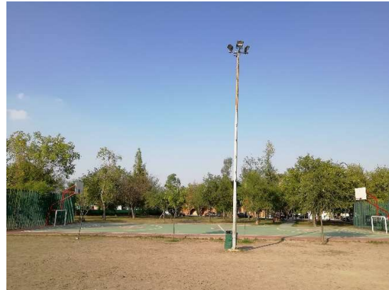
Ilustración 4 Cancha verde