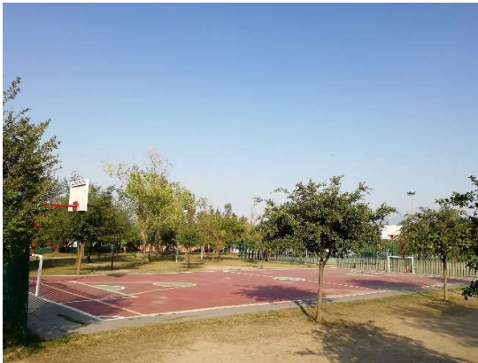
Ilustración 3 Cancha roja

Asimismo, otra opción es hacerlo sobre alguna de las dos canchas que ya existen, de manera que se aproveche el espacio para que la cancha sirva como suelo y que la edificación, además de funcionar como auditorio, pueda servir para techar la cancha cuando se utilice para hacer deportes.