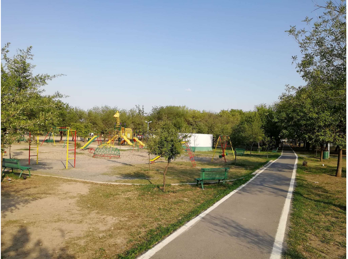
Ilustración 1 Vista general del parque Abraham Lincoln

El parque Abraham Lincoln, también llamado por los vecinos “Bosque Lincoln” es un espacio muy preservado por los habitantes de las colonias cercanas