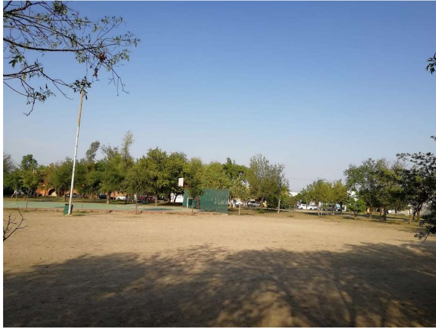
Ilustración 2 Terreno en el centro del parque

En el parque hay espacios amplios llenos de árboles y otros sin árboles ni objetos, como éste, que es un terreno aproximadamente de 200 m 2 en el que es posible cimentar el auditorio.