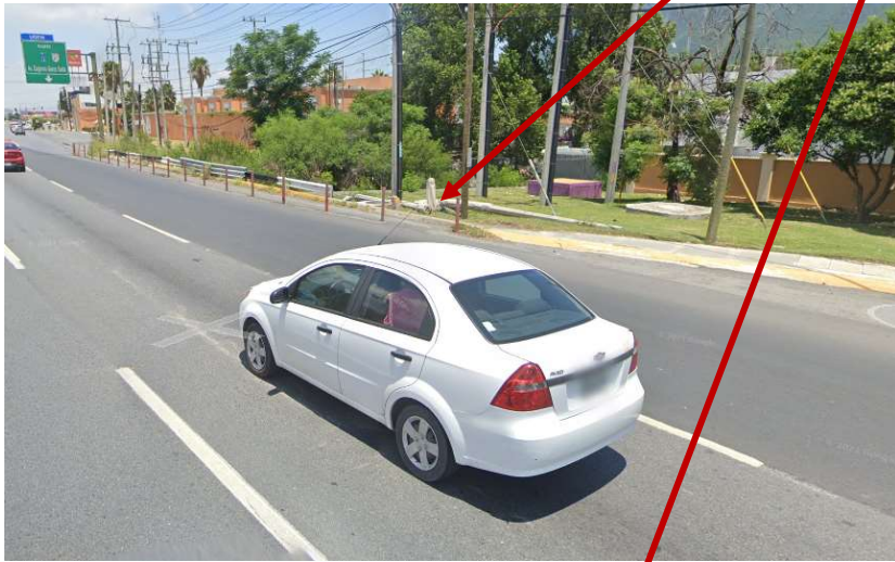
Área para peatones sobre la carretera