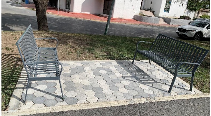
Par de Bancas Propuestas