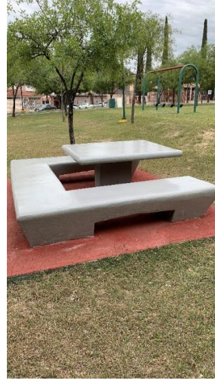
Banca Picnic propuesta