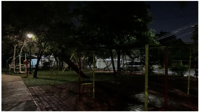
Estado actual de luminarias