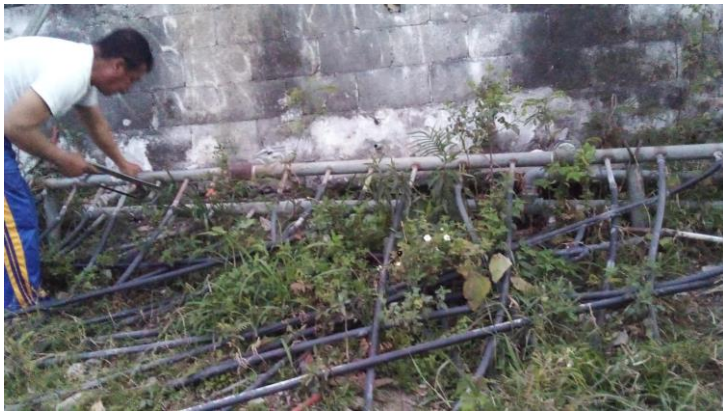
Foto actual de la Pila con las mangueras conectadas.