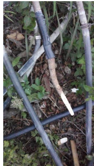
Foto evidencia del estado actual de las mangueras y malas conexiones.