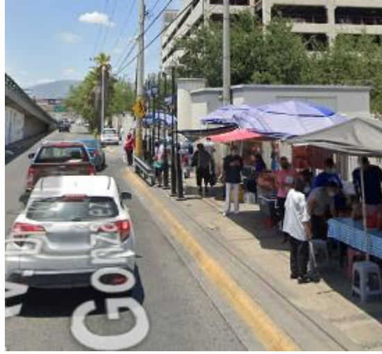
Junto a la entrada del HU invadida por puesteros