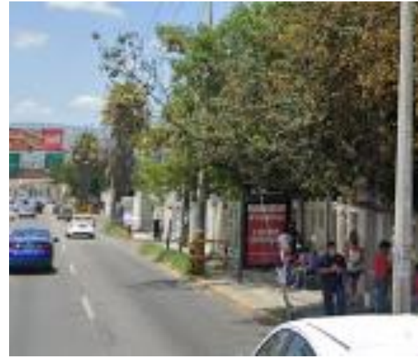
MUPIS invadiendo la acera