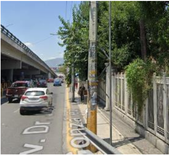
Cerca de la entrada al hospital universitario