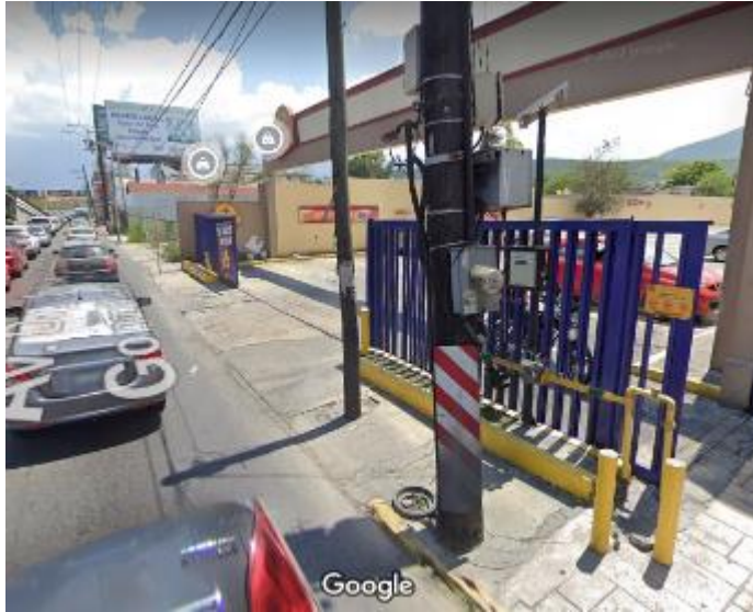
A la altura del Pollo Loco