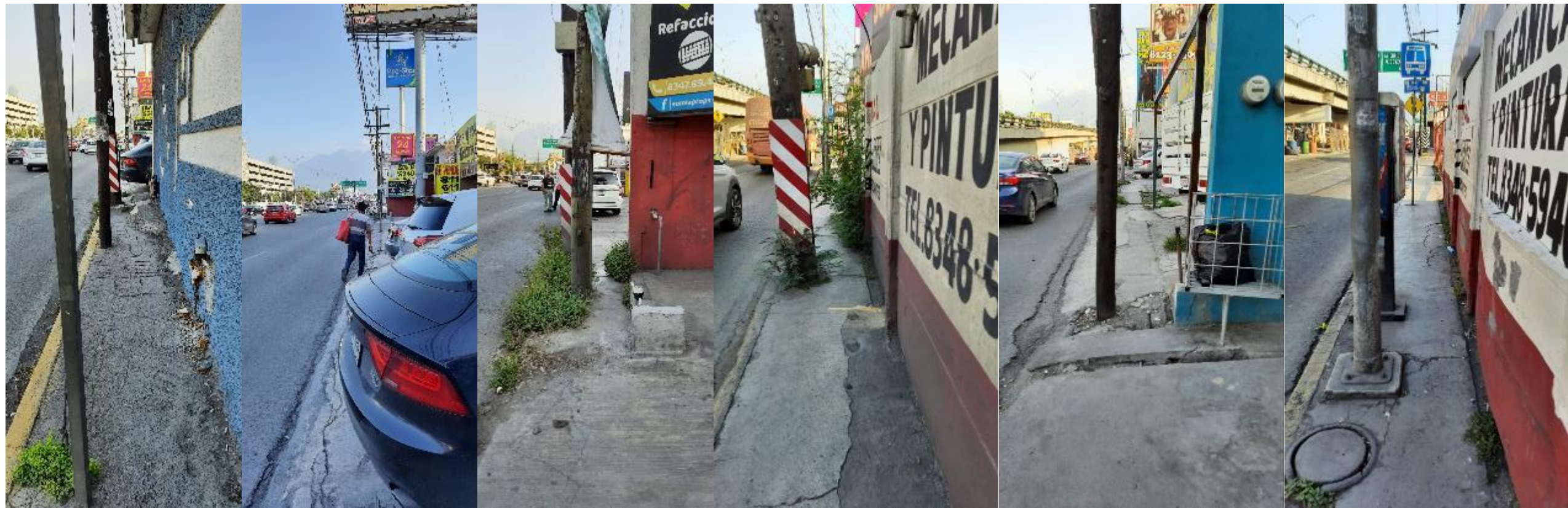
Estado de las banquetas entre Panamá y Enrique C. Livas