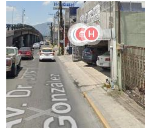
Casi llegando a Leones