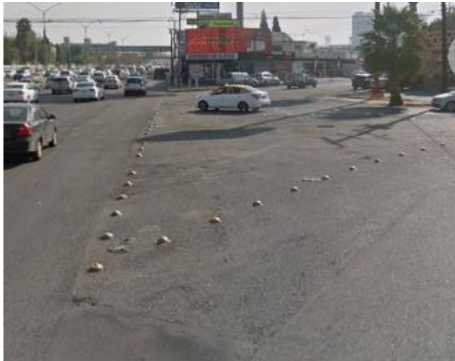
Banqueta inexistente entre Terranova y Canadá

En toda esta zona son inexistentes paradas dignas de transporte público. Postes estorbando a todo lo largo de la banqueta