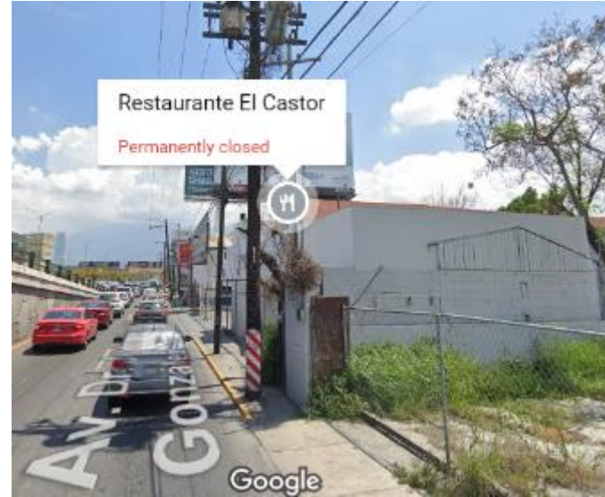
Adelante del Pollo Loco