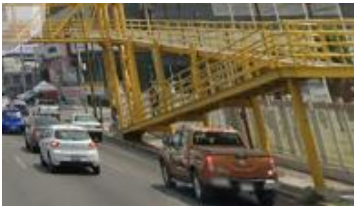
Puente antipeatonal invadiendo la banqueta casi en su totalidad (Mutualismo y Gonzalitos)