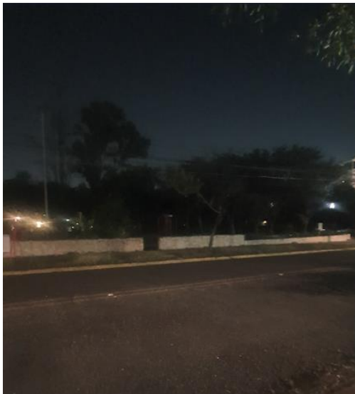
PARQUE ALFONSO REYES APAGADO NOV 28 2022

Solución. Se necesita un cambio total de equipo e instalaciones, incluyendo el cableado, interruptores, tipo de luminaria, agregado de luminaria en puntos oscuros, posición y ubicación de luminaria etc.